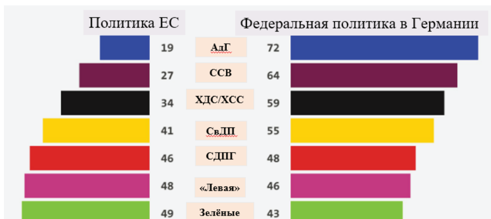
Рисунок 3. Приоритетность европейской и национальной (федеральной) политики для сторонников основных немецких партий на выборах в ЕП 2024 г., %

С точки зрения приоритетности политики, проводимой Берлином и Брюсселем, федеральная имела большую значимость для сторонников АдГ (72%, 19%), ССВ (64%, 27%), ХДС/ХСС (59%, 34%), СвДП (55%, 41%). У социал-демократов оба показателя были ниже 50% (48%,46%), но национальный уровень все-таки немного преобладал. У левых и зелёных он был на втором плане (46%, 48% и 43%, 49% соответственно) (см. рисунок 3) 80 .